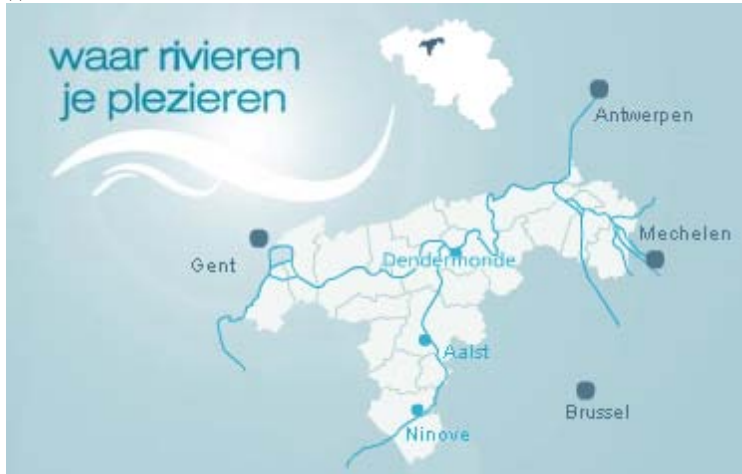
Figuur 2: De toeristische regio Scheldeland (bron: http://www.scheldeland.be )

De toeristische regio Scheldeland wordt geografisch afgebakend als zijnde de 19 Oost-Vlaamse gemeenten en 10 Antwerpse gemeenten, de afbakening van de toeristische regio Scheldeland wordt vanuit marktrelevantie verder aangevuld met de watergebonden toeristische producten van de gemeenten Temse en Kruibeke.