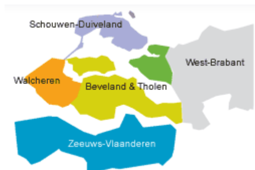
Figuur 1: De toeristische regio's in Zeeland. Omvat de gemeenten: Zeeuws-Vlaanderen (Terneuzen, Sluis, Hulst), Walcheren (Vlissingen, Middelburg, Veere), de Bevelanden & Tholen (Noord-Beveland, Goes, Kapelle, Reimerswaal, Tholen)